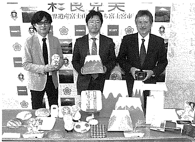
富士パツクの山型や城型の袋は、使用する際は立方体で平面に折り畳めるタイプ。通常は側面を台形にすると底辺の大きさに比べて