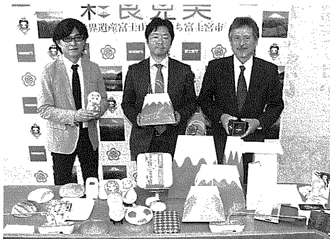
富士パツクの山型や城型の袋は、使用する際は立方体で平面に折り畳めるタイプ。通常は側面を台形にすると底辺の大きさに比べて